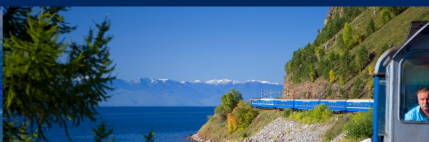
Trens de Luxe