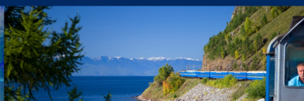
Trens de Luxe