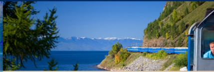
Trens de Luxe