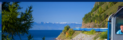
Trens de Luxe